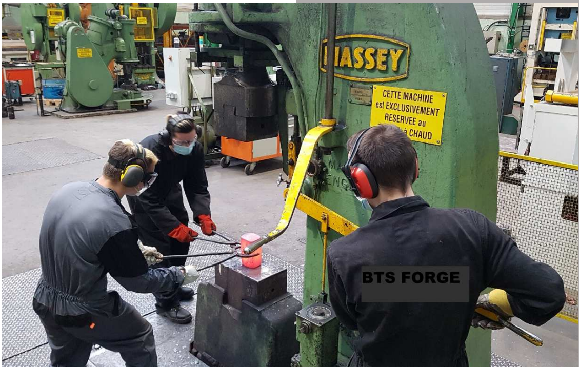
Lycée de Nogent sur Oise Atelier de Forge, Travail en équipe